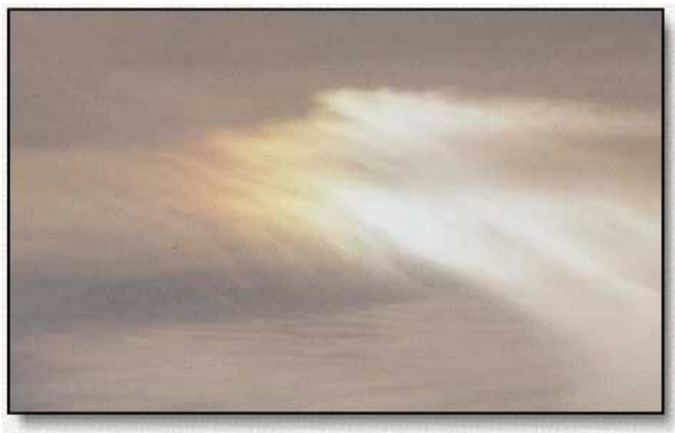
Tämä on kuva yhdestä niistä kolmesta sateenkaaresta Joulukuun 2. 1990.